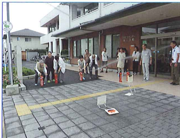
火の標的をめがけて消火訓練