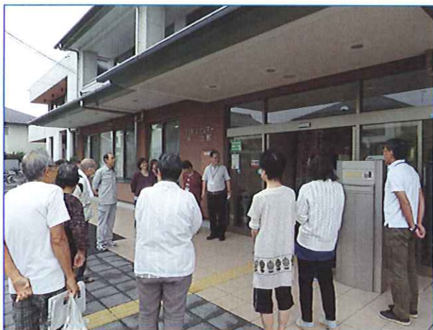
無事みんな避難できました

西一会館では、火災から利用者の安全を守るため、9月8日(火)に、利用者と職員で、避難訓練や通報訓練を行いました。ご協力ありがとうございました。