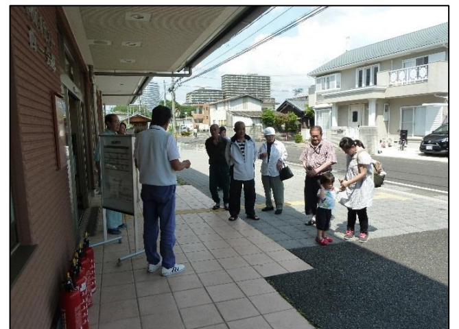
訓練終了のあいさつ