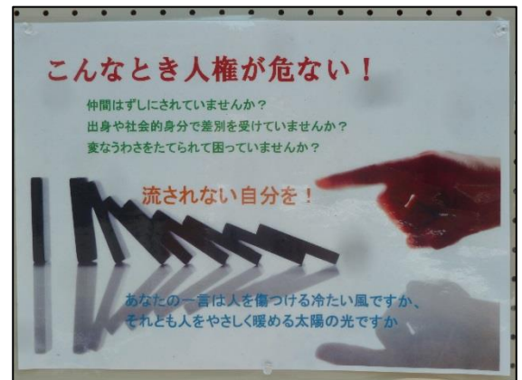
↑ 展示されていた啓発コーナーの一部です。