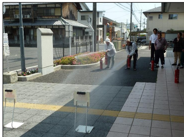
会館を利用中の消火訓練をしている様子