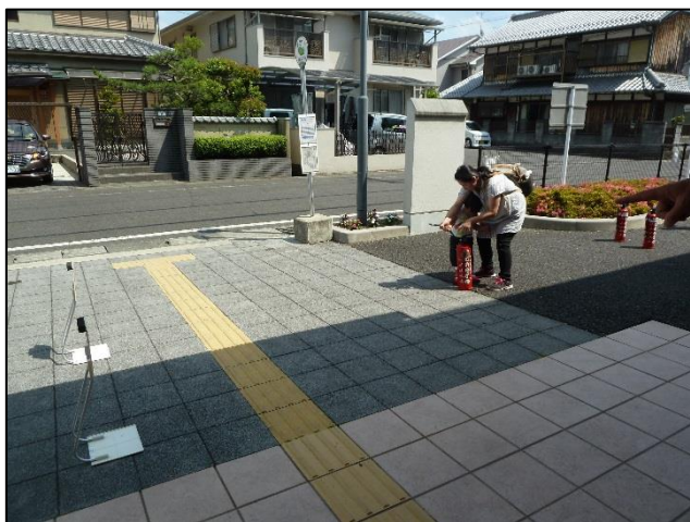
親子で消火訓練をしている様子

5月26日(金) 避難訓練を実施しました。 消火訓練では、お年寄りから小さな子どもまで重い消火器を上手に使うことができました。 参加者の皆さん、ご協力ありがとうございました。