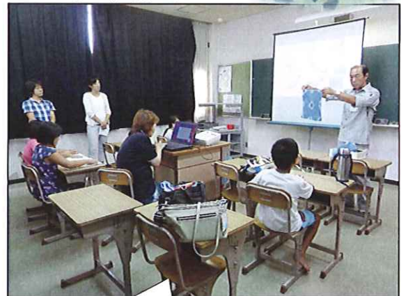
<あい染め体験風景>