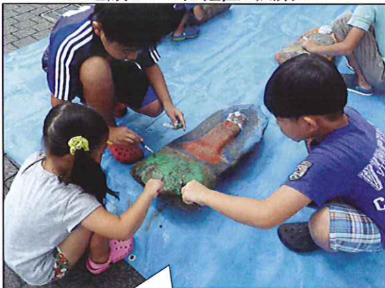
<お地藏さんの化粧直し風景>