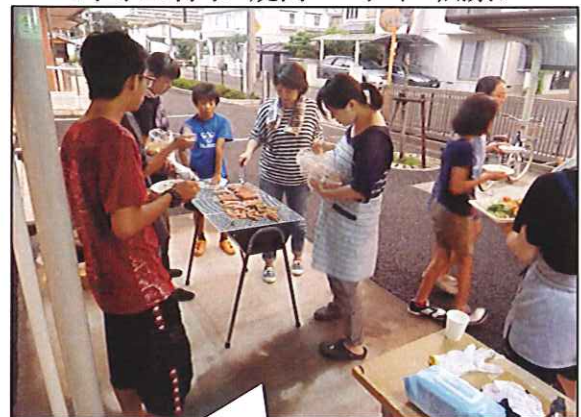
<中学生行事 焼肉パーティー風景>