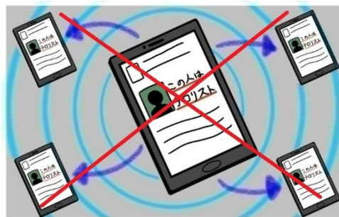
差別や誹謗中傷しない