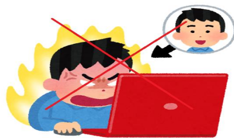
感情的にならない