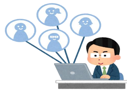
不特定多数を意識する

一度インターネットに載せてしまったら、半永久的に残って思わぬところに拡散してしまいます。「因果応報」という言葉がありますが、誰かを攻撃した言葉は巡り巡って自分に返ってくるかもしれません。匿名だから、ネットだからではなく、だからこそ他人を尊重する気持ちや礼儀、マナーが問われていることを肝に銘じるべきです。