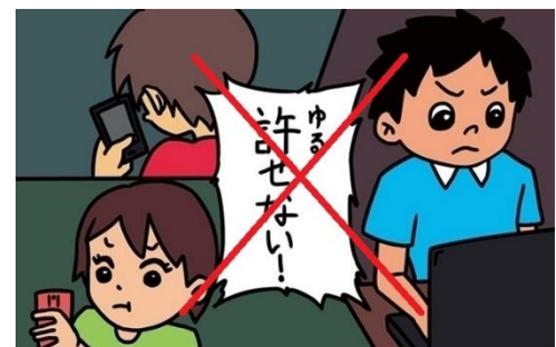
集団で誰かを攻撃しない