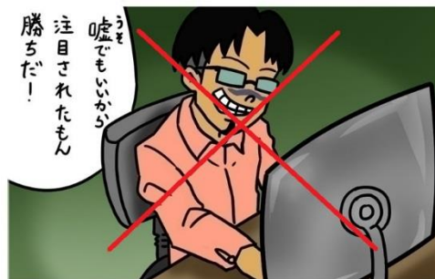
嘘や噂を書き込まない