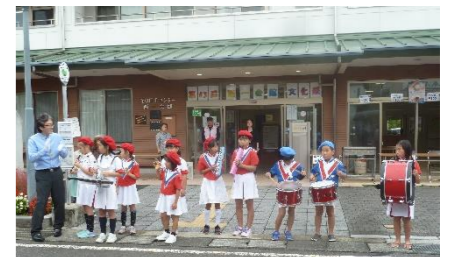
鼓笛隊の元気いっぱいの演奏とともに文化祭が始まりました。