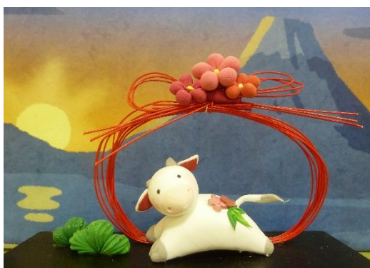
ほっと事業(樹脂粘土)

牛は昔から食料としてだけでなく、農作業や物を運ぶときの労働力として、人間の生活に欠かせない動物でした。勤勉によく働く姿が「誠実さ」を象徴し、身近にいる縁起の良い動物として十二支に加えられたようです。また「紐」という漢字に「丑」の字が使われおり、「結ぶ」や「つかむ」などの意味を込めたとも考えられています。