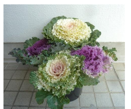
寄せ植え(葉ぼたん)