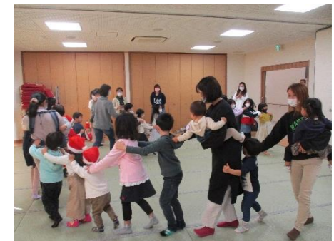
最初は「じゃんけん列車」友だちとの距離も縮まりリラックスした表情になりました。

12月24日(金) 子育てサロンとなかよしひろばの交流会で「クリスマス会」をしました。