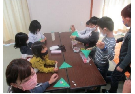
みんなが作ったツリーを合わせて「巨大クリスマスツリー」を作りました。