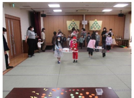
白いケーキにフルーツを載せて「デコレーション」おいしそうなケーキが出来上がりました。