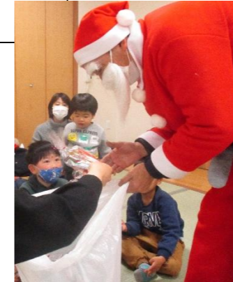
「メリークリスマス🎄」サンタさん登場にみんな大喜び！プレゼントをもらいニコニコの笑顔でした。