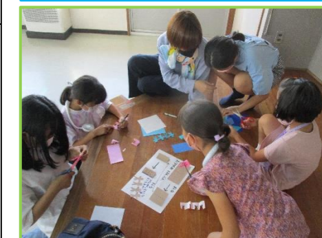
小学生自主活動学級