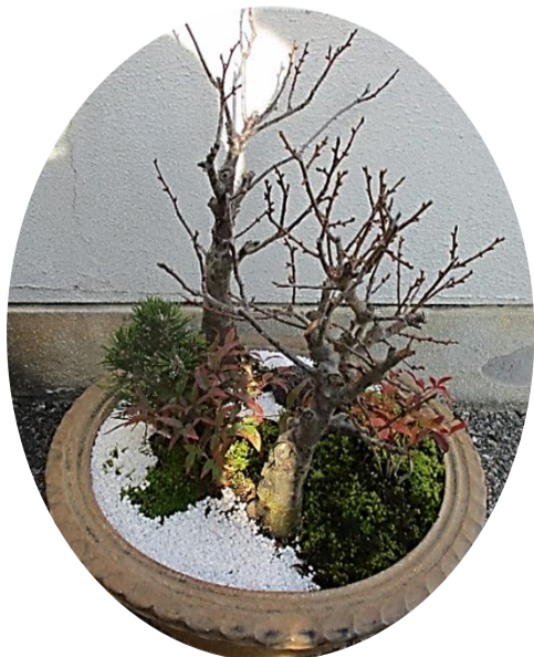
松竹梅の寄せ植え